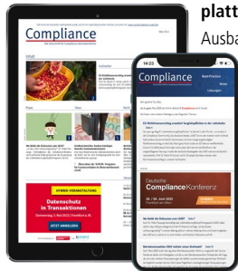
Online-Zeitschrift und Newsletter

„Compliance“ ist die zentrale Informations- und Kommunikationsplattform für Compliance-Verantwortliche im deutschsprachigen Raum. Die Online-Zeitschrift wird an rund 8.500 Abonnenten per E-Mail-Newsletter versendet und kann auch direkt über www.compliance-